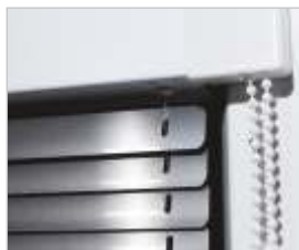
żaluzja 16 mm